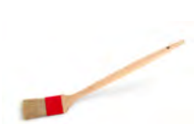
Heizkörperpinsel Art.-Nr.: 16239