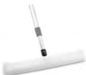
Wischwiesel Art.-Nr.: 16247