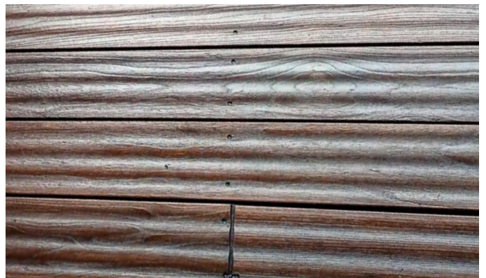
Renovierte Terrasse aus Thermo-Esche nach der Veredelung mit DeckFinish Color Dunkelbraun.