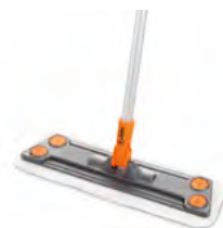
Mop Art.-Nr.: 16244